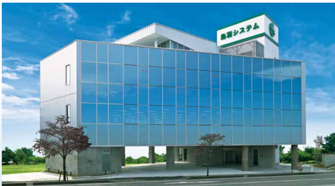
鳥羽システム本社ビル

〒380-0836 長野県長野市南県町1082 KOYO南県町ビル4階 TEL 026-219-3583 FAX 026-219-3584