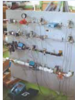
分析計サンプリング装置